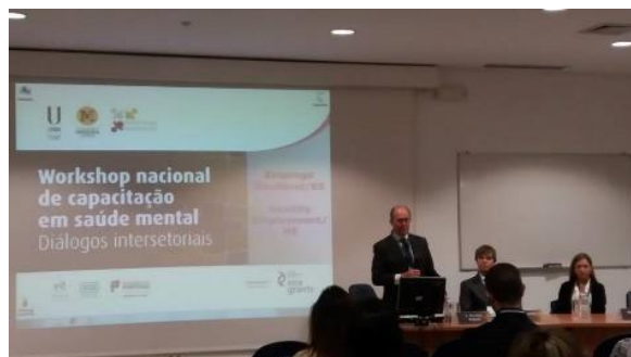
Fig. 3. Sessão de abertura do Workshop nacional de capacitação em saúde mental - Diálogos intersetoriais .

Durante os meses de abril e maio de 2016, o projeto ES esteve envolvido na organização do Workshop Nacional de Capacitação em Saúde Mental – diálogos intersetoriais . O evento decorreu na Faculdade de Medicina da Universidade de Lisboa, no dia 13 de maio. Este workshop reuniu vários peritos, decisores políticos, parceiros nacionais e internacionais, stakeholders , investigadores, estudantes e público em geral. Foram apresentadas e debatidas as temáticas do desemprego e emprego temporário, literacia em saúde mental, sinalização e encaminhamento de pessoas em risco, engagement no trabalho, identificação e prevenção de burnout . A componente prática do evento, que incluiu a formação de grupos de trabalho em sessões paralelas, permitiu a apresentação de evidência e discussão de ideias.